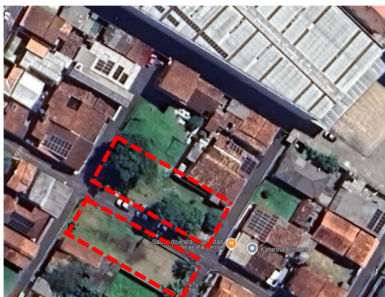
Ilustração 2 - Localização da Praça do Conjunto Pindorama

A proposta está embasada primeiramente com Projeto Básico de Arquitetura, constante de implantação, planta baixa, planta convencionada, layout, orçamento analítico e cronograma físico-financeiro